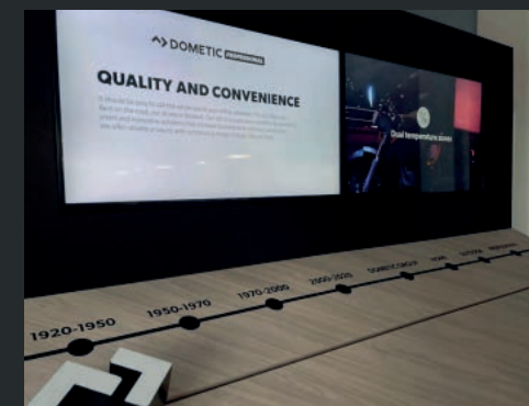
Dometic visar upp sin historia med hjälp av olika nedslag längs en tidslinje.