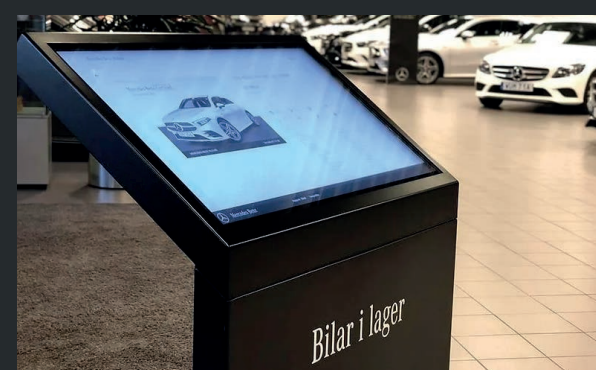
Mercedes Benz begagnathall i Malmö.