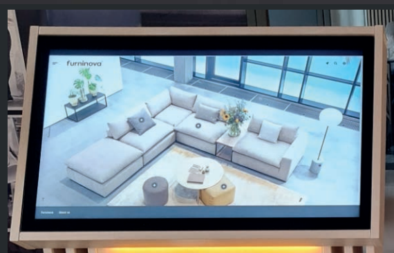
Furninova visar upp sitt produktsortiment och konfiguratorer på The totem.