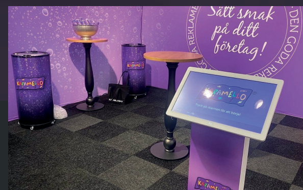
Karamello visar upp godsaker på Lightkiosken på Elmia.