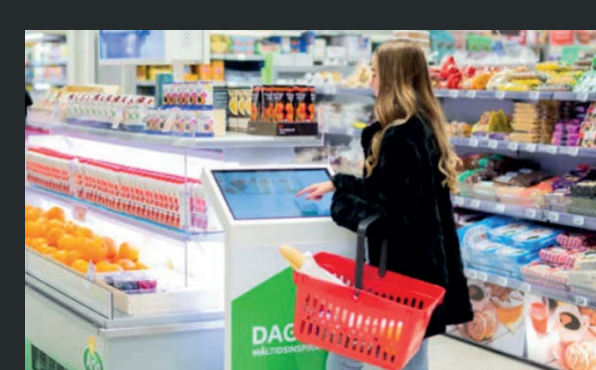
Arla använder kiosk premium i dagligvaruandeln där den inspirerar kunder med recept och måltider.