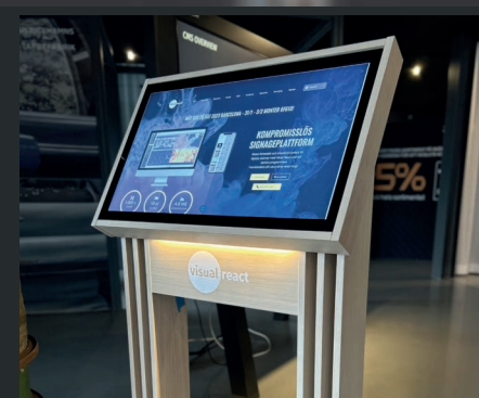
LED-belysning lyser på logotypen under skärmen.