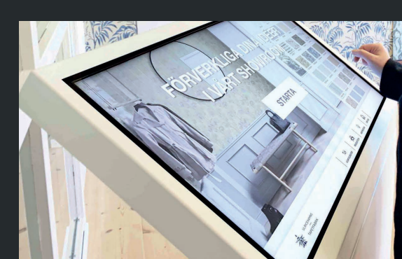
Konfiguratorer gör sig extra bra på 32" modellen där grafiken blir snäppet större.