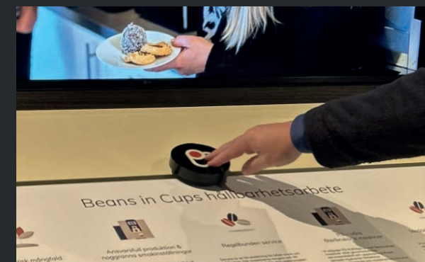
För logotypen längs linjen för att upptäcka nytt innehåll på skärmen.