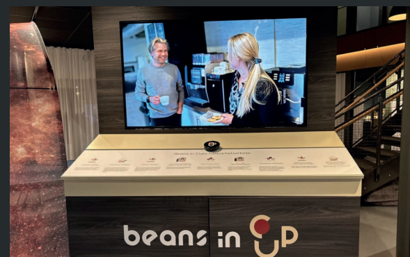
Beans in cup visar upp sitt varumärke med hjälp av en slide and explore möbel.

Möbeln kläs med budskap utifrån önskemål.