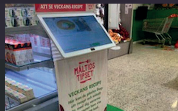
Arla använder lightkiosken för permanenta installationer som inspirerar kunderna i mejeriavdelningar.