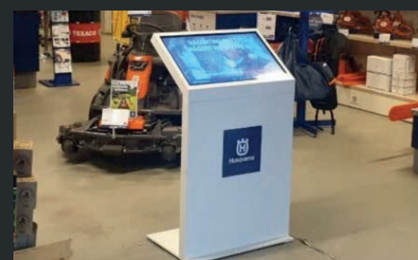
Husqvarna-återförsäljare i Tyskland.