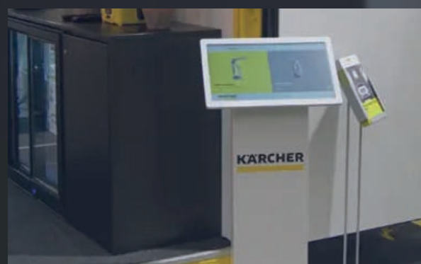
Lightkiosken passar perfekt på mässan. Kärcher använder den frekvent i olika montrar och byter enkelt ut innehållet varje gång.