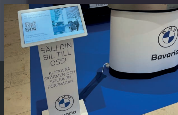
Bavaria använder lightkiosken för popups i olika gallerior runt om i Sverige.